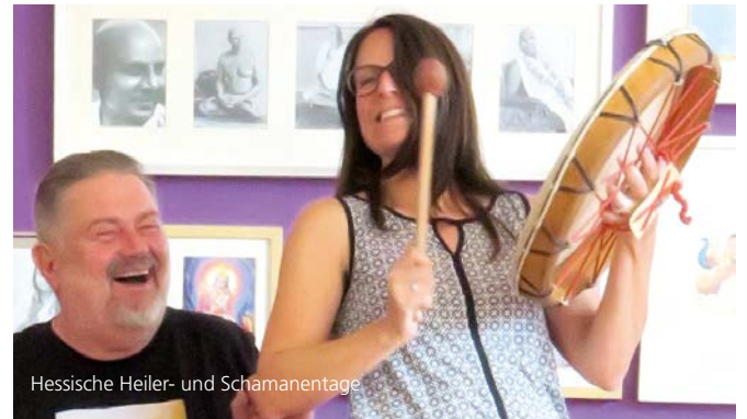
Hessische Heiler- und Schamanentage

Studierende der Hochschule für Musik Mainz, im Kursaal der Parkklinik Schlangenbad, www.parkklinik-schlangenbad.de